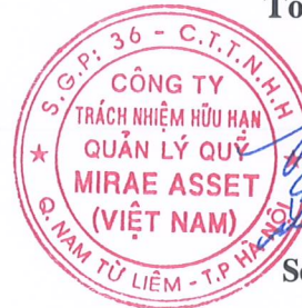
Soh Jin Wook